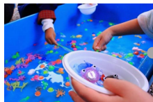
スーパーボールすくいや、輪投げなどが楽しめる子供縁日 🕒9:30～14:00 直接会場にお越し下さい。