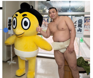
人気の力士と握手したり、写真を撮影できる！登場力士はお楽しみに！ 🕒9:00～10:00 直接会場にお越し下さい。